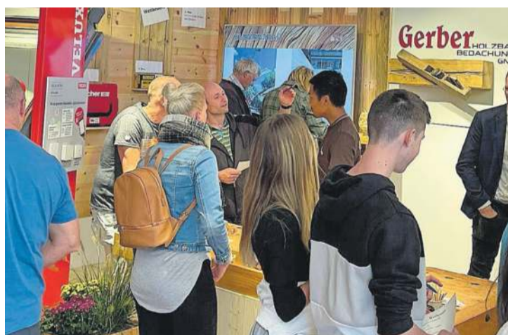
Viel Interessantes wird es auch an dieser MUGA zu sehen geben.